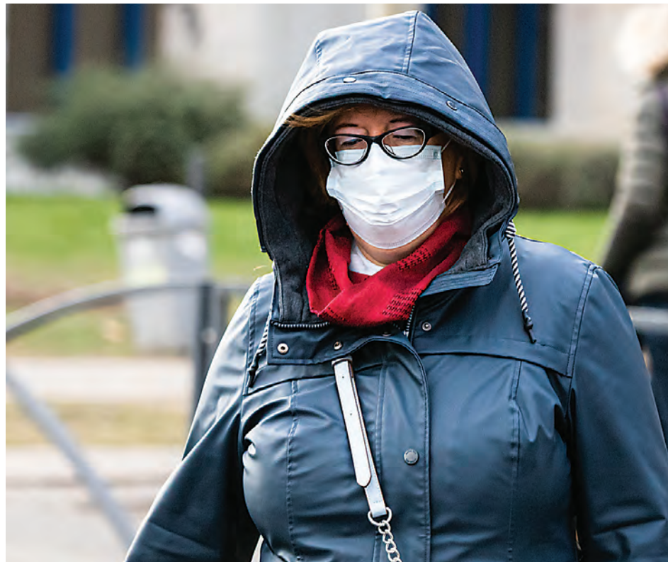
Les lieux publics qui ne sont pas indispensables sont désormais fermés.

Les cégeps et les universités sont également fermés pour la même période. Tous les services de garde sont aussi fermés