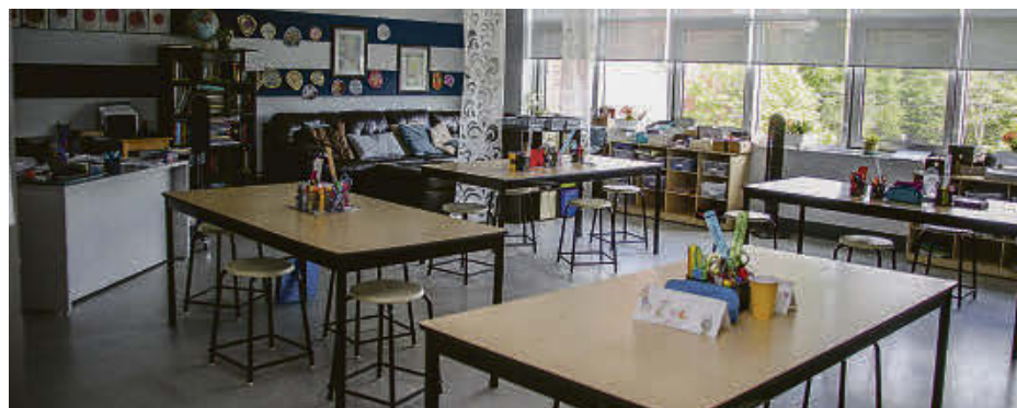
Les écoles de la province sont fermées pour au moins les deux prochaines semaines.

Ces deux services accueillent des enfants de 4 à 13 ans.