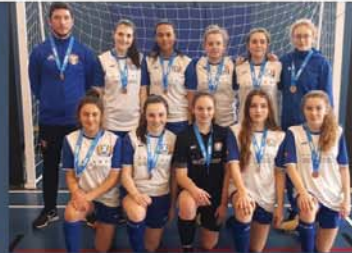
L'équipe féminine, catégorie Cadet est montée sur le podium.