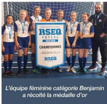
L'équipe féminine catégorie Benjamin a récolté la médaille d'or

Trois équipes de futsal de l'école De Mortagne ont remporté les grands honneurs lors du championnat régional, division 2, du Réseau du sport étudiant du Québec (RSEQ) Montérégie présenté les 16 et 17 mars à Saint-Lambert. Les athlètes sont en effet montés sur le podium à trois reprises.