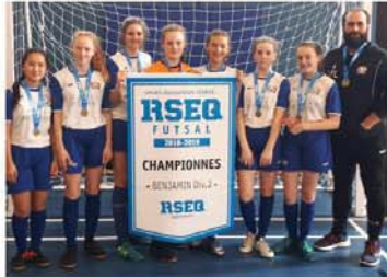
L'équipe féminine catégorie Benjamin a récolté la médaille d'or

Le futsal est un sport apparenté au soccer. Il regroupe plus de 150 équipes au Québec.