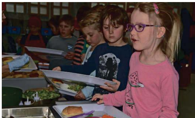
De jeunes élèves de la maternelle juste avant d'entamer leur repas.