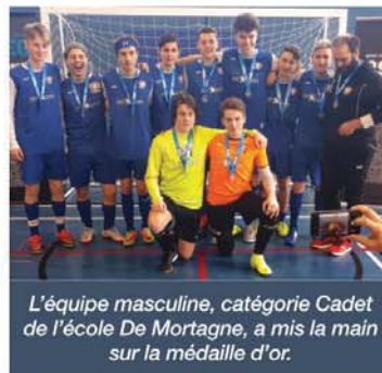
L'équipe masculine, catégorie Cadet de l'école De Mortagne, a mis la main sur la médaille d'or.

L'équipe féminine catégorie Benjamin a récolté la médaille d'or, alors que l'équipe de niveau cadet a décroché le bronze. L'équipe masculine, catégorie Cadet, a quant à elle gagné la médaille d'or. Les équipes féminine et masculine de l'Impact du Collège Durocher Saint-Lambert ont, de leur côté, mis la main sur deux bannières de champions dans la catégorie Cadet.