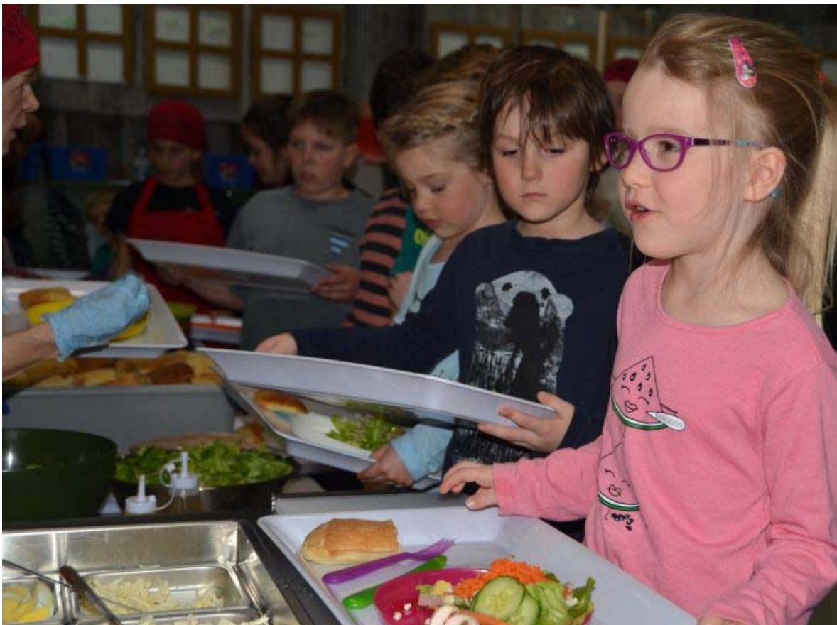
De jeunes élèves de la maternelle juste avant d'entamer leur repas.