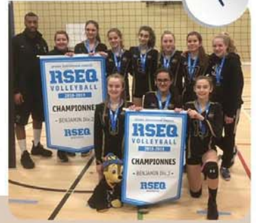
L'équipe féminine De Mortagne en route vers les championnats provinciaux.

L'équipe Noir et Or, catégorie Benjamin, ira aux championnats provinciaux.