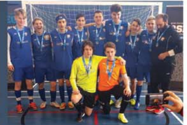
L'équipe masculine, catégorie Cadet de l'école De Mortagne, a mis la main sur la médaille d'or.