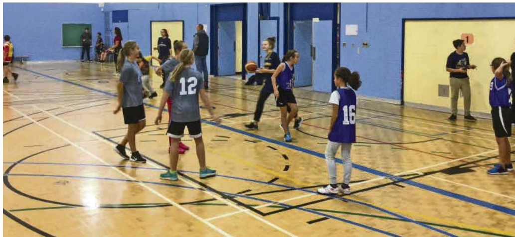
La ligue de basket de la CSP offre des confrontations à 3 contre 3 et 4 contre 4.

« Nous voulions que les jeunes fassent d'autres sports. Souvent, le mini volleyball et le kin-ball sont très populaires. Je me suis dit que le basket serait apprécié des jeunes s'ils touchent au ballon beaucoup, explique