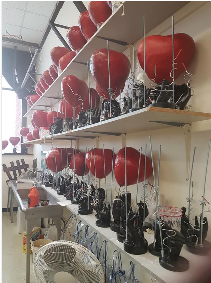
Un aperçu des oeuvres créées par les élèves.