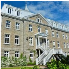
Ville de Varennes

Le conseil municipal de Varennes a souligné les efforts d'élèves varennois pour leur persévérance scolaire. Ces derniers ont été désignés par leur école respective pour s'être démarqué depuis le début de l'année.