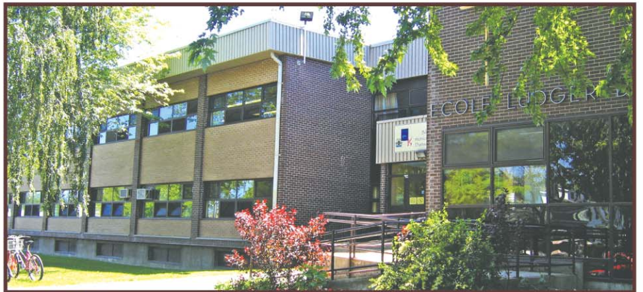
Pour l'école Ludger-Duvernay à Verchères, une somme de 4 millions de dollars a été accordée afin d'ajouter une classe d'éducation préscolaire et cinq classes d'enseignement primaire.

OSD ORCHESTRE SYMPHONIQUE DE LONGUEUIL MARC DAVID