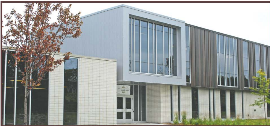
Pour l'école des Cœurs-Vaillants à Contrecoeur, un montant de 5,57 millions de dollars a été attribué pour l'ajout d'une classe d'éducation préscolaire, de six classes d'enseignement primaire et l'agrandissement du gymnase.