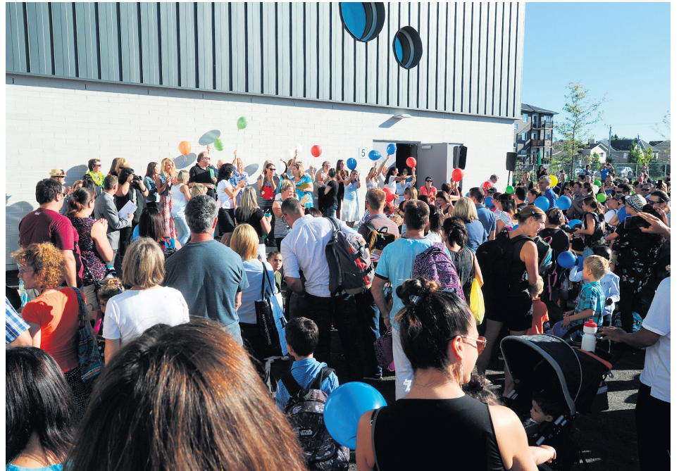
La rentrée aura lieu le 31 août à la Commission scolaire des Patriotes.