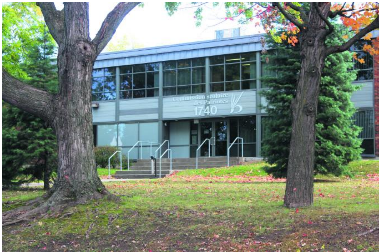
La rentrée scolaire se déroulera le 31 août à la CSP.