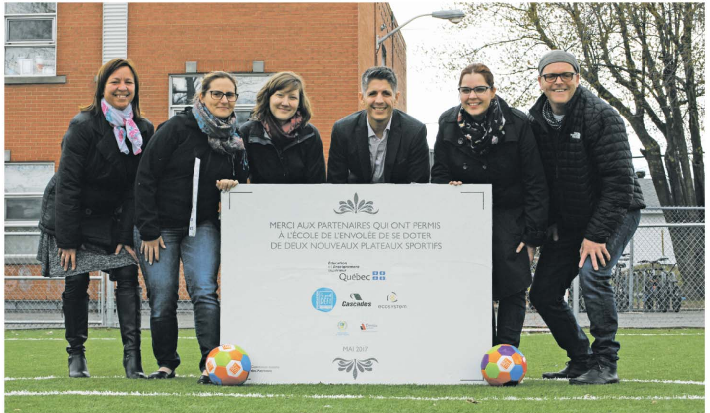
Le directeur d'école et les principaux partenaires qui ont permis ce bel aménagement.

Aujourd'hui, l'école de l'Envolée est dotée d'un nouveau terrain de basketball et d'un mini terrain de soccer au gazon synthétique!