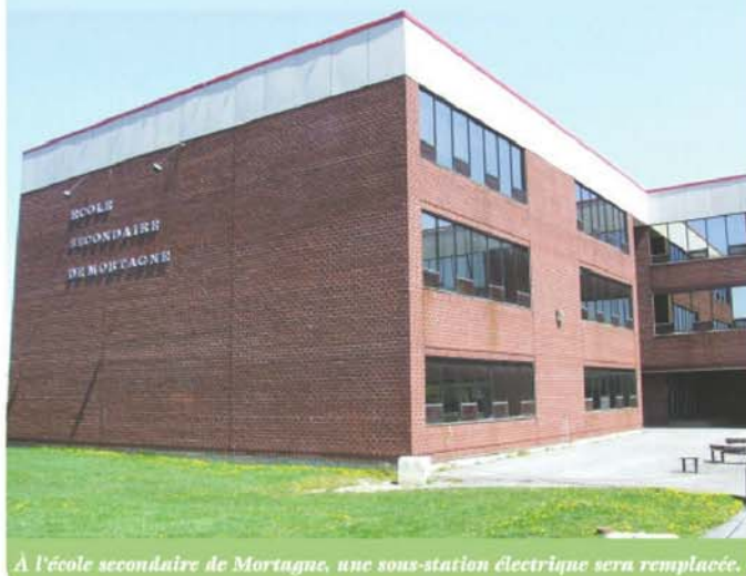
À l'école secondaire de Mortagne, une sous-station électrique sera remplacée.