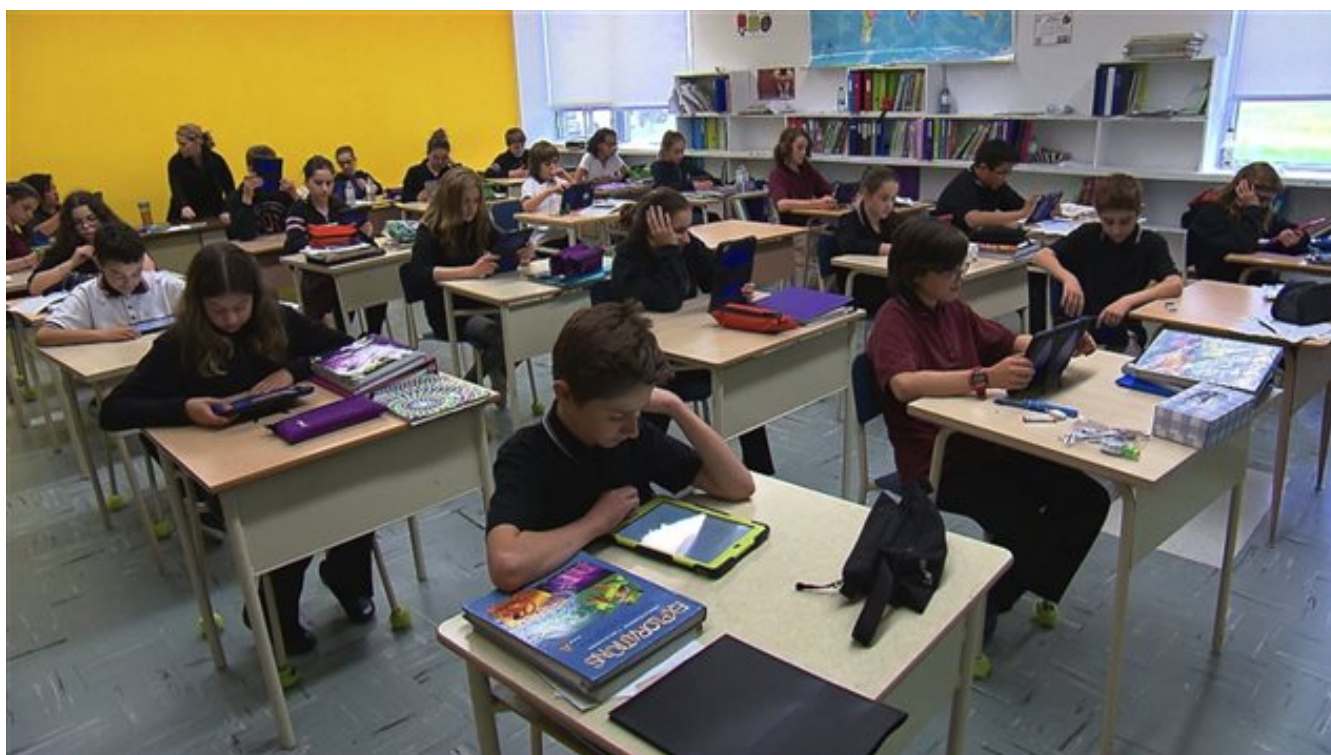
Des élèves en classe.

La démographie et l'immigration risquent de créer une pression sur les écoles des commissions scolaires francophones de Montréal et de la Rive-Sud à la rentrée scolaire 2016, selon les prévisions d'inscriptions. Certaines commissions scolaires sont prêtes, alors que d'autres manquent d'espace et cherchent des solutions.