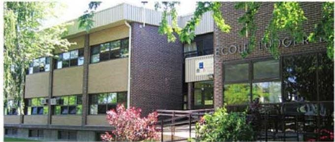
À l'école Ludger-Duvernay de Verchères, on investira 182 377$ afin d'assurer l'imperméabilisation de la fondation et la décontamination de sol.

La CSP a indiqué qu'un montant de 7,8 millions de dollars sera investi en travaux de rénovation et réfection de plusieurs écoles. Dans la MRC de Marguerite-D'Youville, quatre écoles se retrouvent dans la liste des plus importants travaux qui seront entrepris. À François-Williams à Saint-Amable, on verra au remplacement des portes extérieures et à la réfection du système d'alarme incendie pour une somme de 152 359$, alors