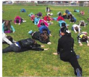
Activité de yoga à l'école Paul-VI.