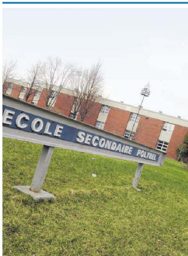
L'école Polybel fait partie des écoles où des travaux de rénovation sont prévus.