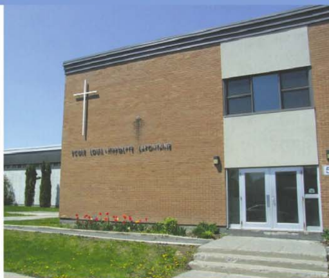
À l'école Louis-H.-Lafontaine, les travaux comprendront la réfection de l'enveloppe du bâtiment et le remplacement de la ventilation du gymnase.

La Commission scolaire des Patriotes prévoit accueillir 32 300 élèves à la rentrée scolaire 2016-2017 dans ses 54 écoles primaires, 11 écoles secondaires, son centre de formation professionnelle et son centre de formation pour adulte.