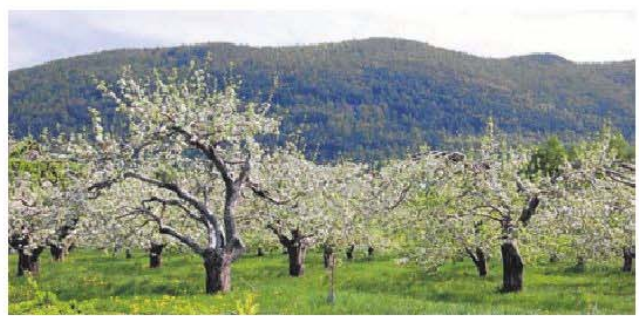
Dans le cadre des Fêtes du 50 e anniversaire à la Ville de Mont-Saint-Hilaire, l'Association des pomiculteurs invite les gens à participer aux pique-niques dans les vergers les 21 et 22 mai entre 11h et 15h. (Photo: Association des pomiculteurs de Mont-Saint-Hilaire)

(Sources: Ville de Mont-Saint-Hilaire et l'Association des pomiculteurs de Mont-Saint-Hilaire)