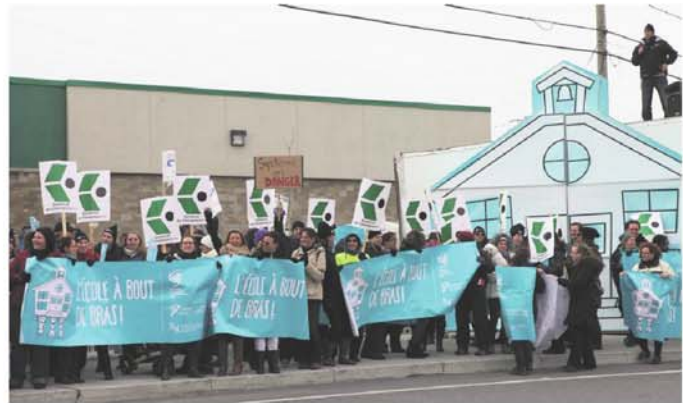
Un premier jour de grève paralysera les écoles publiques le 28 octobre.