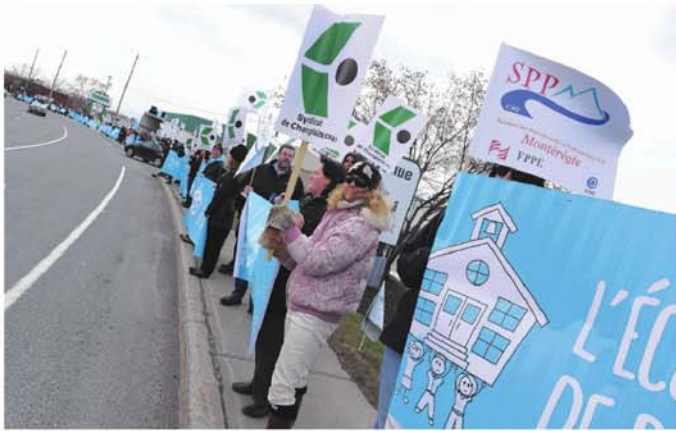
La première des six journées de grève des enseignants sera déclenchée mercredi prochain.