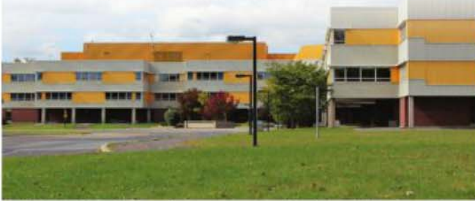
L'École secondaire du Mont-Bruno offre deux nouveaux projets pédagogiques particuliers. (Photo : archives)

La Commission scolaire des Patriotes (CSP) est fière d'annoncer la mise en place de deux nouveaux projets pédagogiques particuliers à l'École secondaire du Mont-Bruno, soit Sports-aventure et Sciences. Ces deux programmes seront offerts à compter de septembre 2016.