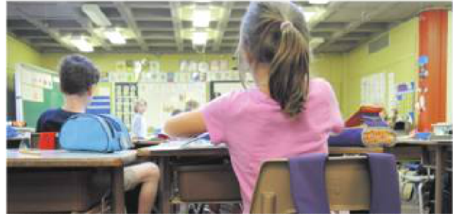
Le taux de diplomation à la Commission scolaire des Patriotes est de 81,5 %, alors qu'il est de 77,7 % pour l'ensemble du Québec.

En septembre, le ministre de l'Éducation François Biais a annoncé que Québec ne renouvelait pas plusieurs ententes de partenariat financier avec des organismes impliqués dans la prévention du décrochage scolaire. Cette perte de plus de 25 millions de dollars inquiète quelque peu le directeur adjoint de la Commission scolaire des Patriotes. «C'est malheureux, car il y avait divers services en cours sur notre territoire qui étaient offerts par le programme Réunir Réussir. Ce programme, financé par les