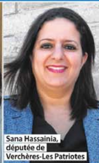
Sana Hassainia, députée de Verchères-Les Patriotes