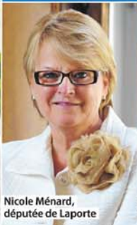
Nicole Ménard, députée de Laporte