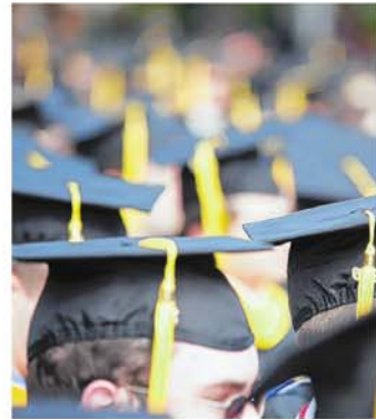
Réussite Montérégie, qui travaillait pour la réussite scolaire, n'existe plus.

MARTINE VEILLETTE martine.veillette@tc.tc