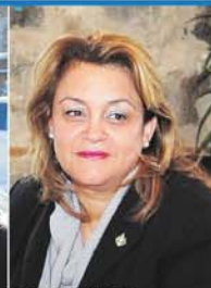
Djaouida Sellah, députée de Saint-Bruno-Saint-Hubert