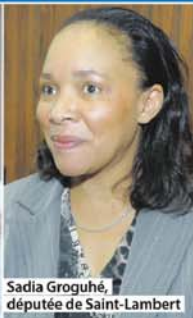
Sadia Groguhé, députée de Saint-Lambert