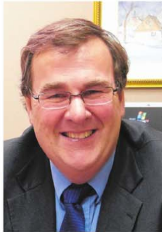
Le nouveau ministre de l'Éducation et député de Charlesbourg, François Blais.