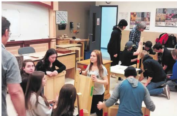
Dans le cadre d'un avant-midi d'exploration des programmes du CFPP, des élèves ont pu participer à une compétition pour monter un meuble.