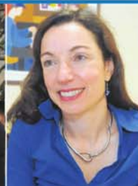
Martine Ouellet, députée de Vachon