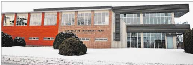
La SECTEAU croit en la sécurité de ses installations.