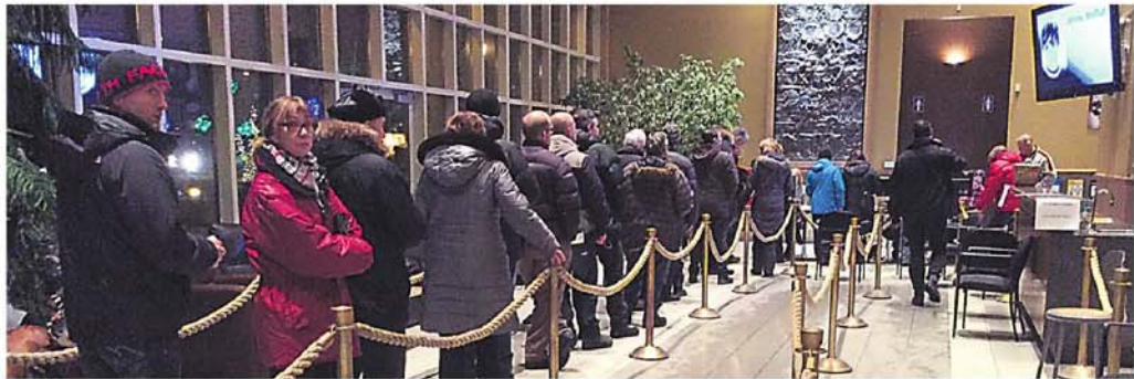
Les citoyens qui ne souhaitent pas être dédommages pourront s'exclure du recours collectif.

« Nous considérons qu'une telle démarche