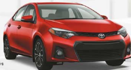
Modèle S illustré

Aucun paiement pendant 90 jours avec le financement à l'achat.**