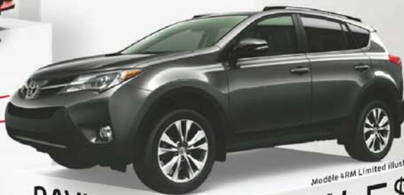
Modèle 4RM Limited illustré

En location 64 mois 153 $ Paiement bimensuel 0 $ d'acompte