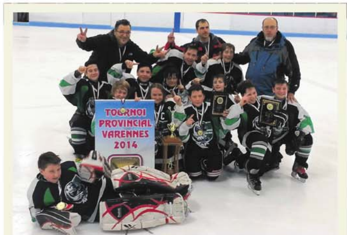
Le Grizzly Nordique peewee B de Sainte-Julie a terminé l'année en beauté.