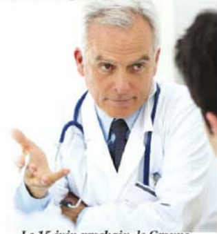
Le 15 juin prochain, le Groupe de médecine familiale des Seigneuries cessera ses activités.

« Nous éprouvons une grande, grande tristesse pour nos 6 500 patients qui devront se tourner de bord et nous aurions aimé qu'il en soit autrement, mais ça fait 10 ans qu'on se démène pour que ça marche, malgré tout. On a fait preuve de résilience. On a mené nos batailles, mais il y a une limite à ne pas franchir