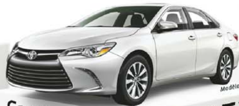
Modèle XLE illustré

En location 64 mois 96 $ Paiement bimensuel 0 $ d'acompte