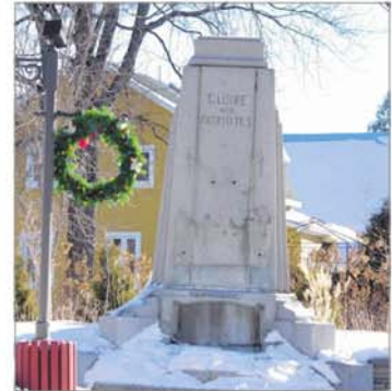
C'est la deuxième fois en quelques mois que le monument est la cible des voleurs.