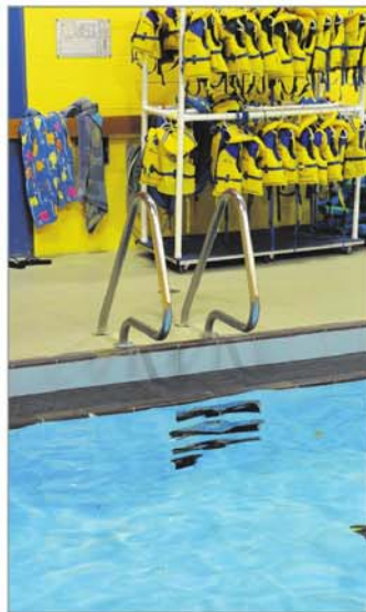
Six municipalités s'unissent pour construire un centre aquatique régionale alors que la piscine de l'école secondaire Polybel fermera en juin 2015.