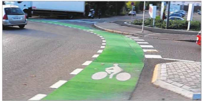
Du marquage de couleur verte est notamment utilisé en Allemagne.

Selon lui, l'idéal pour la sécurité des cyclistes est d'aménager des pistes cyclables unidirectionnelles de chaque côté de la chaussée. Ainsi, le risque de collision entre une voiture et un vélo est moins élevé.