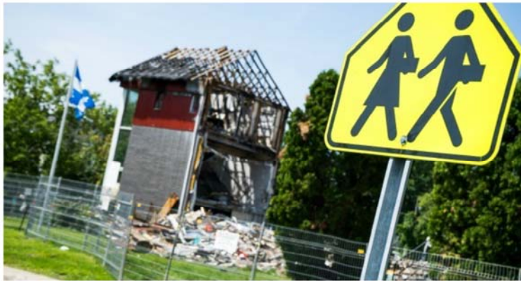
L'incendie s'était déclaré le 11 juillet aux environs de 0 h 20 et aurait pris naissance sur une table à pique-nique adjacente à l'école.

Accueil » Articles » Actualités » Poursuite d'un million contre McMasterville: le processus suit son cours