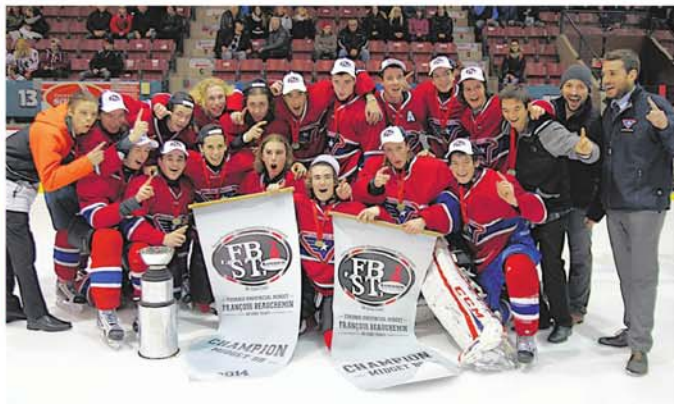
Le Blitz de Varennes midget BB.