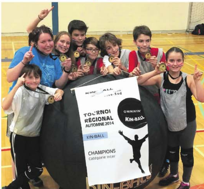
L'équipe des Canadiens, de l'école l'Arpège de Saint-Julie.