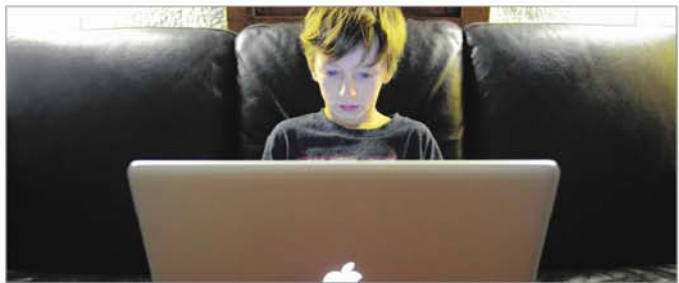
Les élèves HDAA peuvent utiliser un ordinateur lors d'examens.

des examens, par clé USB, était problématique parce que les élèves éprouvaient de la difficulté à sauvegarder correctement leur examen et que certaines clés étaient perdues, indique Mme Rabouin.