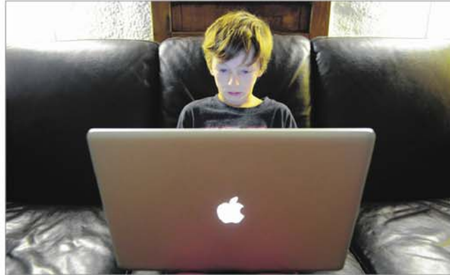
Les élèves HDAA peuvent utiliser un ordinateur lors d'examens.

L'ancienne distribution électronique des examens, par clé USB, était