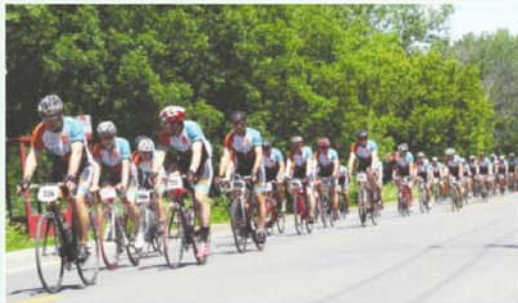
Les participants au Grand Défi Pierre Lavoie ont traversé Boucherville sous les encouragements des citoyens.

Juin * Un nouvel organisme, le Club cycliste Boucherville, reçoit son accréditation de la Ville de Boucherville.