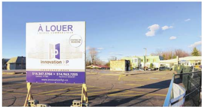
Un centre de santé pourrait voir le jour l'été prochain sur le site de l'ancien centre commercial, situé sur la route 116 à l'entrée de Mont-Saint-Hilaire.

La firme a déposé son plan d'implantation la semaine dernière à la Ville de Mont-Saint-Hilaire et espère inaugurer le centre à l'été 2015. L'investissement du projet est évalué à 7,5 M$.