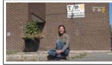
À Travers l'objectif - 109 Transféré Il y a 1 jour