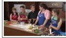
Passion Cuisine junior (... Transféré Il y a 1 jour