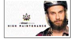
High Maintenance - Trai... De Janky Clown Productions

S'inscrire Se connecter Créer Regarder Mettre en ligne