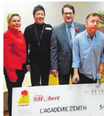
La remise de chèque à l'Académie Zénith lors du 6 novembre dernier

En 2015, plusieurs événements sont à venir pour l'Académie Zénith, dont la marche du Défi Scotia, prévue en avril,