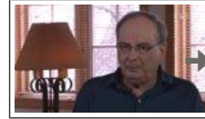
Paroles d'auteurs, épis... Transféré Il y a 4 jours