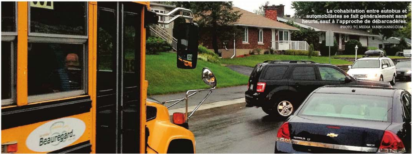
La cohabitation entre autobus et automobilistes se fait généralement sans heurts, sauf à l'approche de débarcadères.