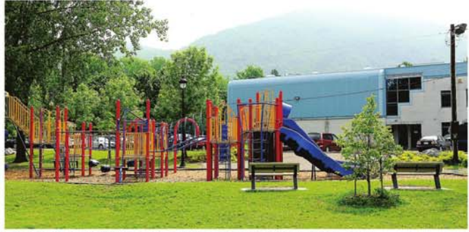
LA CSP va ajouter sept nouvelles classes à l'école de l'Aquarelle.

Le maire pense que le fait que les élèves fréquentent une école loin de chez eux aura un impact social: «J'ai des amis que je connais depuis l'âge de 7 ans, parce que j'ai pu tisser des liens qui ont duré, illustre-t-il. À l'époque, les enfants d'un même voisinage se suivaient tout au long de leur cheminement