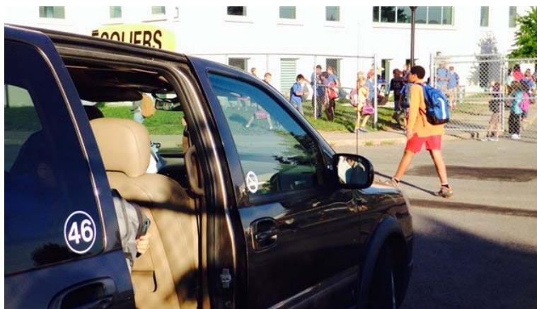
Tous les matins, une soixantaine de véhicules transportent à l'École Vanguard les élèves qui proviennent de 14 commissions scolaires.

La famille Melançon estime qu'il y a une autre option pour leur problème de transport. La Commission scolaire Marie-Victorin voisine transporte tous les jours une douzaine d'élèves de la Rive-Sud vers l'école Vanguard.