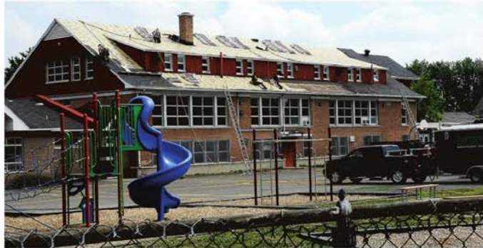
La nouvelle Farandole accueillera les élèves de la maternelle à la 6 e année sous un même toit.

ment, on allait chercher un grand bassin d'enfants qui pouvaient marcher au lieu de prendre l'autobus.» Elle croit qu'avec l'agrandissement de l'école de l'Aquarelle, un plus grand nombre d'élèves seront obligés d'utiliser le transport scolaire, ce qui augmentera nécessairement les coûts du service.