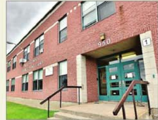
L'école François-Williams.

En plus du taux de natalité élevé et de l'arrivée de jeunes familles, Saint-Amable doit aussi composer avec une