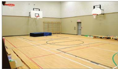
La nouvelle école de Contrecœur accueillera 237 élèves le 2 septembre prochain.