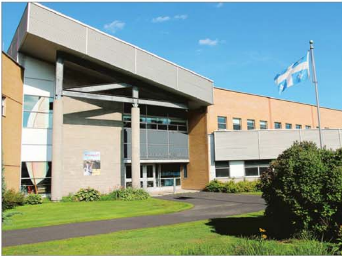
Les élus carignanois ont adopté un projet de potager communautaire sur un terrain de la municipalité, adjacent à l'école du Parchemin.