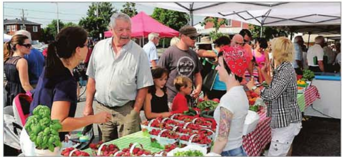
Le marché public de Sainte-Julie sera accessible jusqu'au 25 septembre.