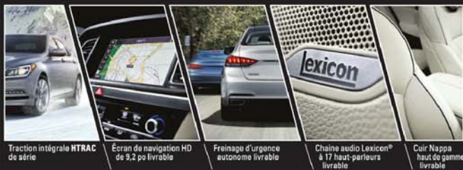
Traction intégrale HTRAC de série