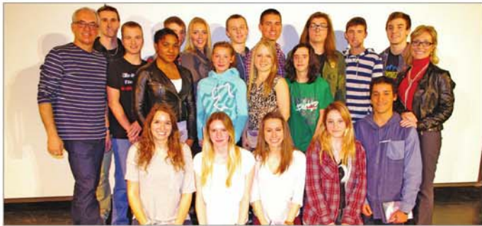
Les lauréats du Festival du cinéma étudiant de l'école de Mortagne.

Tous les spectacles de la région, tous les jours, sur www.la-seigneurie.qc.ca