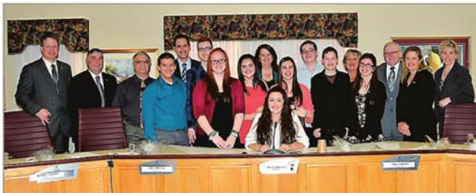
Les neuf participants ont eu la chance de devenir maire ou conseiller d'un soir le temps d'une séance spéciale.