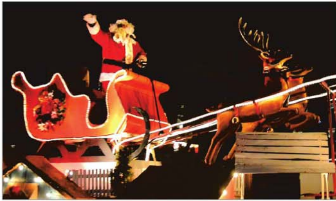
Le père Noël était très attendu.