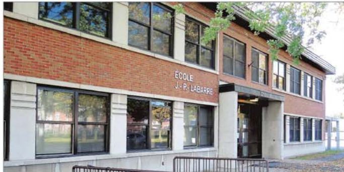
La vocation de l'école J.P.-Labarre changera en septembre prochain.

Les travaux de réaménagement commenceront en juin, à la fin des classes. Tout devrait être prêt pour la prochaine