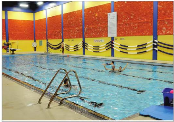
Selon une résidente, qui se rend à la piscine deux fois par semaine, on doit continuellement ajouter de l'eau.