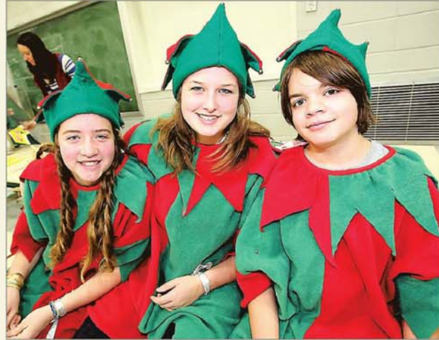
Les lutins ont aussi fait de cette fête une réussite.

La Direction des loisirs de Saint-Amable n'hésite pas à dire que cette tradition a été cette année «un très grand succès!»