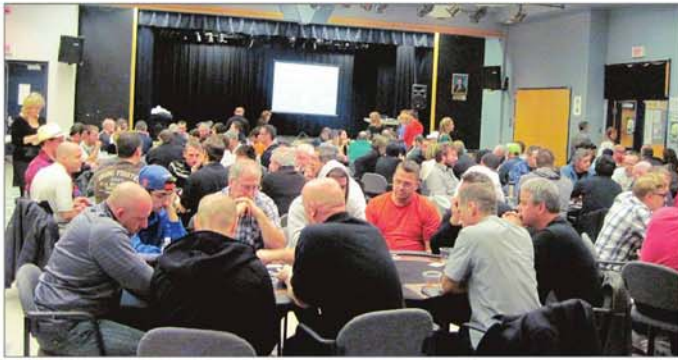
Des joueurs nombreux et généreux pour la cause des jeunes hockeyeurs.