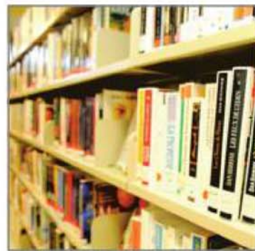
Le livre numérique n'a pas encore fait son entrée dans les bibliothèques des écoles.

Le ministère a évalué que le réseau scolaire a besoin de 200 bibliothé-