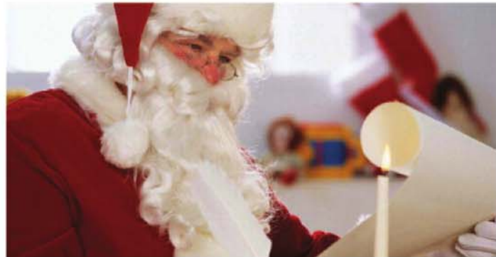
Le père Noël ne saura plus où donner de la tête le samedi 30 novembre prochain puisqu'en plus du défilé de nuit dans les rues de Sainte-Julie, il sera à midi à l'école secondaire François-Williams de Saint-Amable!