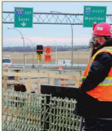
Les travaux à l'intersection de l'A-20 et de l'A-30 seront stoppés provisoirement dans quelques jours.

des bénévoles en chef et un défi constant. Non seulement il faut se lever tôt chaque matin de la semaine pour remplir la tâche, mais il faut aussi apporter une stabilité aux jeunes. «C'est dur de trouver quelqu'un qui est rassembleur et qui deviendra significatif pour les enfants, qui leur inspirera confiance», précise-t-elle.