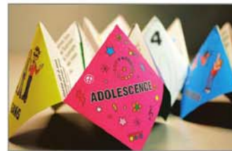
Un projet innovateur, les coins-coins pour contrer l'intimidation.

Récemment, un vaste mouvement a littéralement pris d'assaut les 53 écoles primaires de la Commission scolaire des Patriotes (CSP). Du préscolaire à la 6 e année, les membres du personnel de chaque école se sont mobilisés pour équiper leurs 20 000 élèves afin de lutter contre l'intimidation.