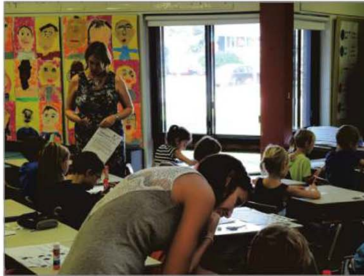
Les classes de cette école sont à aires ouvertes.

La direction de l'école Monseigneur-Gilles-Gervais a d'ailleurs rencontré les parents récalcitrants en petits groupes au début de l'année afin de les rassurer. «On a été disponibles pour les parents dès le début du processus», dit Mme Fiset.