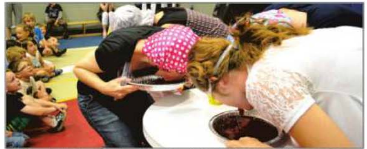
Des enseignants de l'école du Parchemin réalisant, le 21 juin, le défi lancé par les élèves qui ont lu 50 000 livres.

Comme ils ont finalement réussi à lire tous ces livres, les membres du personnel ont dû se contraindre à mettre leur visage dans le Jello pour récupérer un bonbon. Tout le monde a trouvé cela bien drôle!