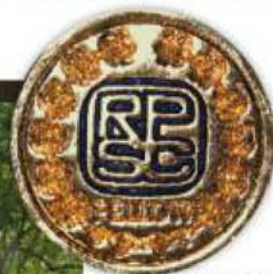
Épinglette unique aux Fellows

La plus haute distinction en philatélie canadienne décernée à un Bouchervillois