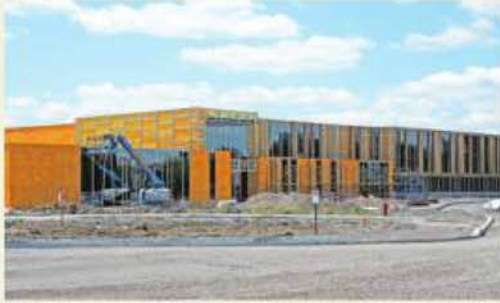
Le nombre d'élèves dans la région ne cesse d'augmenter. La CSP veut ajouter une nouvelle école à Chambly en plus de celle déjà en construction à Carignan.