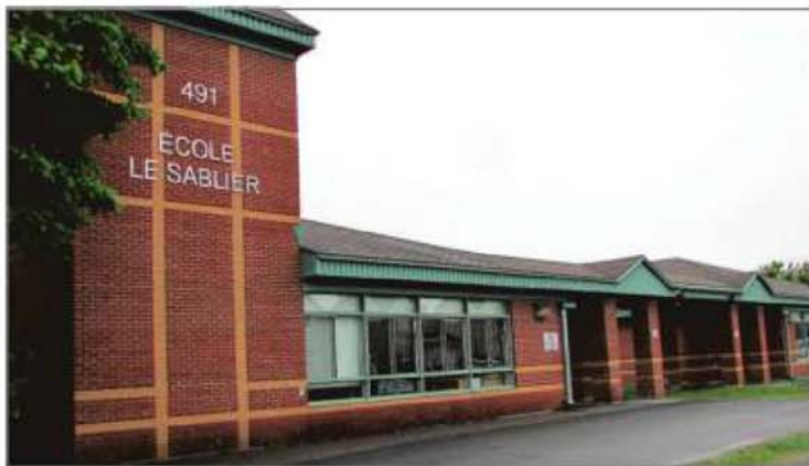
Saint-Amable compte présentement 3 écoles.

La CSP pourrait ainsi répondre aux besoins de main-d'œuvre dans ce domaine de la région. Ce projet d'agrandissement est lié à l'octroi du droit d'enseigner ce programme, demande pour laquelle une réponse du ministère est attendue au cours de l'automne.