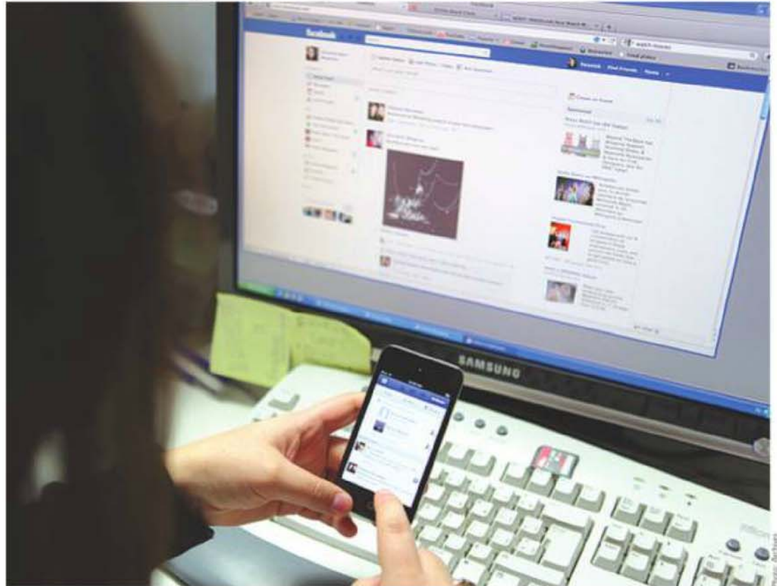
La Commission scolaire des Patriotes (CSP) prévoit lancer un guide d'utilisation de Facebook pour la rentrée scolaire 2012-2013.

établies par la Commission scolaire soient flexibles: «Une école, c'est une communauté. Je ne fais pas semblant de ne pas connaître mes élèves lorsque je les croise dans la rue. Je suis content de savoir ce qu'ils deviennent. Et Facebook sert à établir ce lien.»