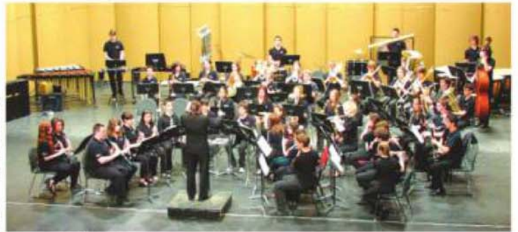
L'Harmonie Élite de l'école secondaire Ozias-Leduc.