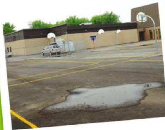
École La Farandole II, McMasterville