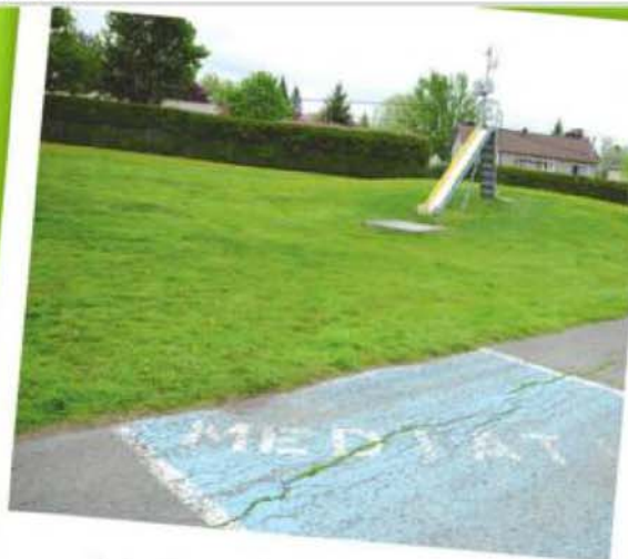
École de La Chanterelle, Saint-Basile-le-Grand

Lors de la construction d'une nouvelle école, comme c'est le cas présentement à Belœil, c'est la CSP qui prend en main l'aménagement complet de la cour, délimitant les espaces gazonnés et installant les équipements de base.