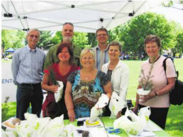
Un groupe d'élèves de l'école Père-Marquette a assisté à la plantation d'un érable Autumn Blaze sur le terrain de l'établissement.

L'école Père-Marquette fait partie des établissements scolaires verts Brandtland, un mouvement qui encourage les gestes environnementaux. La remise de cet érable coïncidait avec le mois de l'arbre et des forêts.