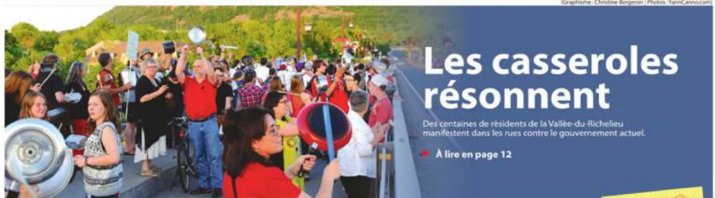
(Graphisme : Christine Bergeron)