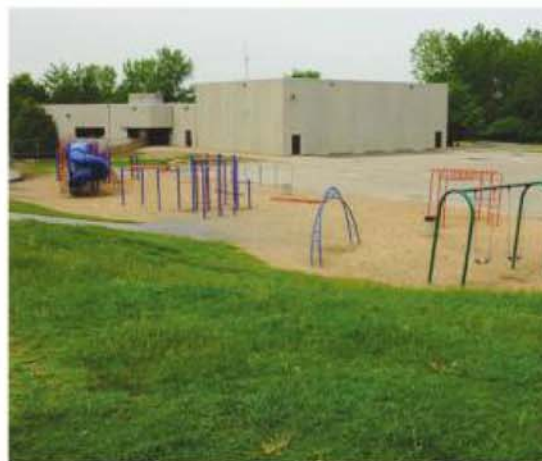
École La Pommeraie, Mont-Saint-Hilaire