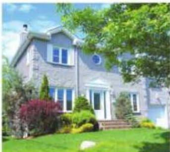
1741, Pease Saint-Bruno. Aucun voisin arrière, secteur de la vieille gare à 5 minutes de centre-ville de Saint-Bruno, clés en main, cottage de 4 CAC, 3 SDB, sous-sol fini, près d'un parc pour jeunes enfants. Ne la ratez pas! 429 900$