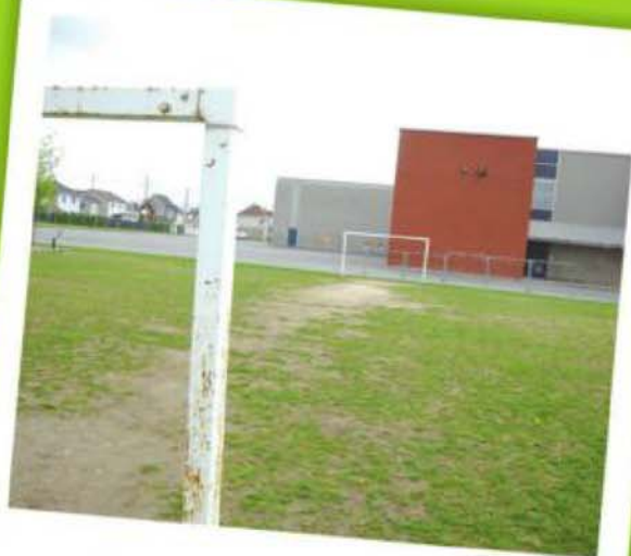
École de La Mosaïque, Saint-Basile-le-Grand