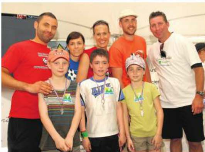
Des jeunes du primaire ont aussi pu participer au Tour de la montagne, avec les courses de 1 km et de 2 km, coordonnées par le Club Récré-Action.