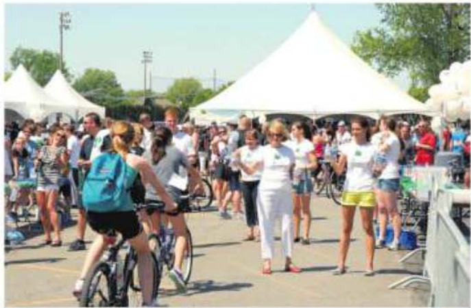
Les participants pouvaient s'inscrire au défi corporatif, au défi-école ou aux parcours de 5 et 23 km.

Des jeunes du primaire ont aussi pu participer au Tour de la montagne, avec les courses de 1 km et de 2 km, coordonnées par le Club Récré-Action. Ils ont pu également assister à un tournoi parascolaire régional de DBL ball.